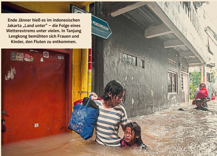
Ende Jänner hieß es im indonesischen Jakarta „Land unter“ – die Folge eines Wetterextrems unter vielen. In Tanjung Lengkon bemühten sich Frauen und Kinder, den Fluten zu entkommen.